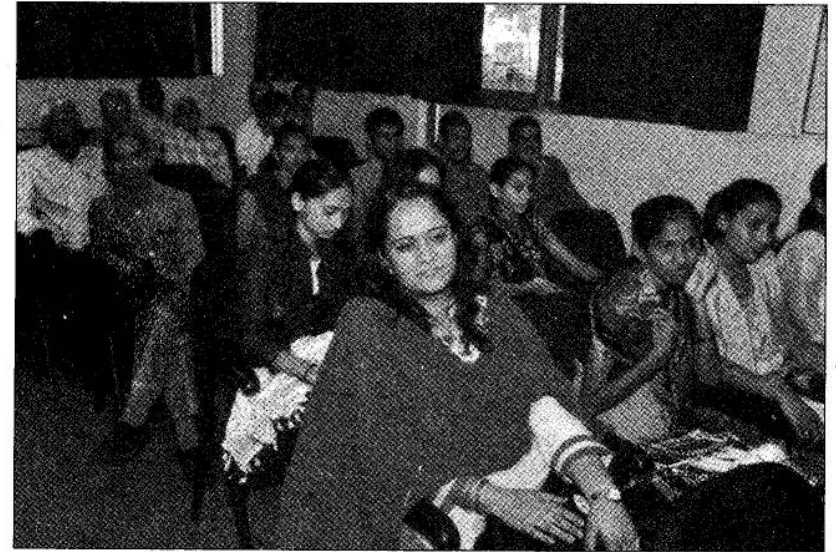
કરુણાપ્રશસ્તિ પરિસંવાદની તસવીર