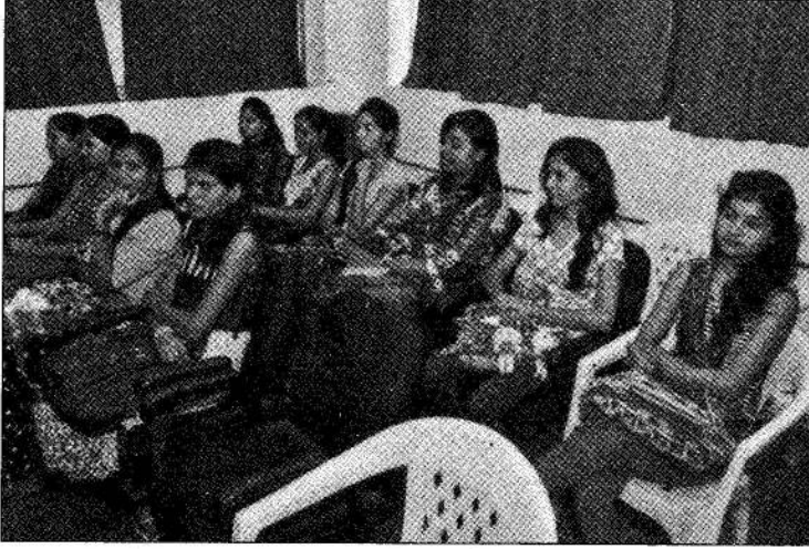
ગુજરાતી દીર્ઘકાવ્ય પરિસંવાદ